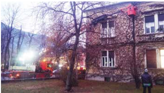
Entfernung des Efeubewuchses im obersten Bereich am Hauptgebäude der Bezirkshauptmannschaft Spittal/Drau.