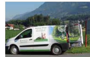
Maschinenring Zeitung Kärnten | Regionalteil