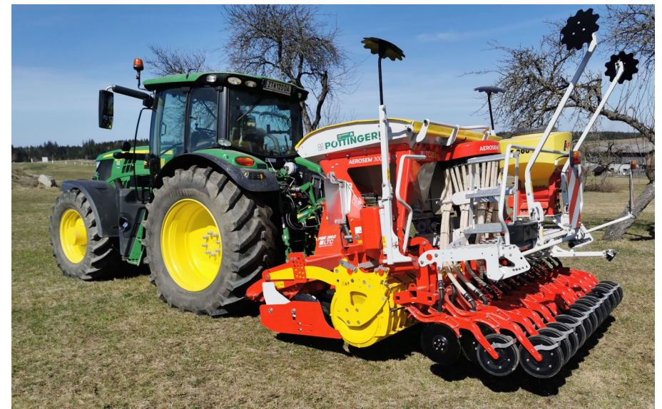
Foto: Traktor und Säkombi Kleinschönau

der Maschinenring ist 365 Tage im Jahr für seine Mitglieder und Kunden da. Mehr als 76.000 Landwirte österreichweit profitieren als Mitglieder mehrfach vom Maschinenring. Sie können Geld sparen durch niedrigere Produktionskosten und sie können Geld verdienen, weil sie die vielfältigen Möglichkeiten auf ein Zusatzeinkommen nutzen. Im Innenteil finden Sie alle Aktivitäten rund um den MR Zwettl-Weitra. Wir treten bereits als Partner vieler land- und forstwirtschaftlicher Betriebe auf, wollen diese Zusammenarbeit mit weiteren Projekten intensivieren bzw. neue Landwirte als Dienstleister gewinnen.